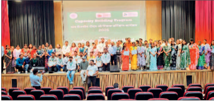
सिंह एस्कॉट के संरक्षण और मार्गदर्शन में संपन्न हुआ।